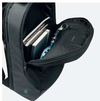
Avec organisateur & accroche clé