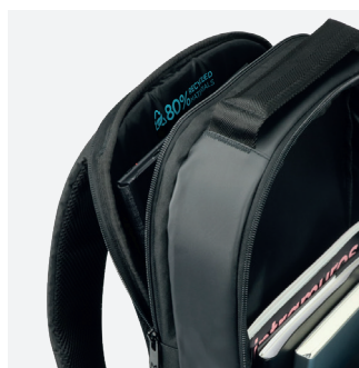
Avec rangement pour tablette