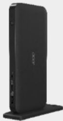
Acer USB Type-C Dock III