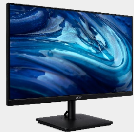
Moniteur 24" ZeroFrame FHD VA2 series