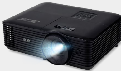
Projecteur 4,500 Lumens SVGA X1128HK