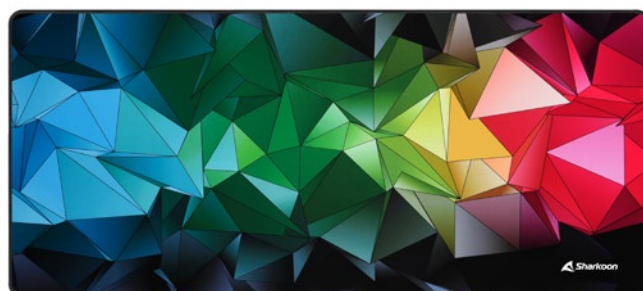
SKILLER SGP30 XXL POLY