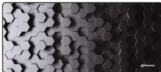
SKILLER SGP30 XXL HEX