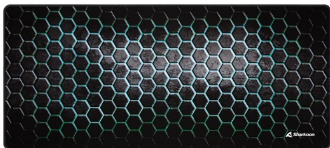
SKILLER SGP30 XXL MESH