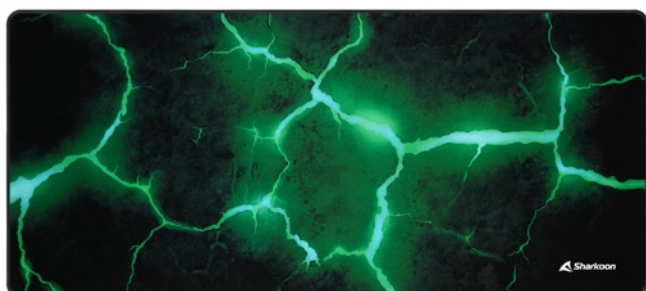
SKILLER SGP30 XXL STONE